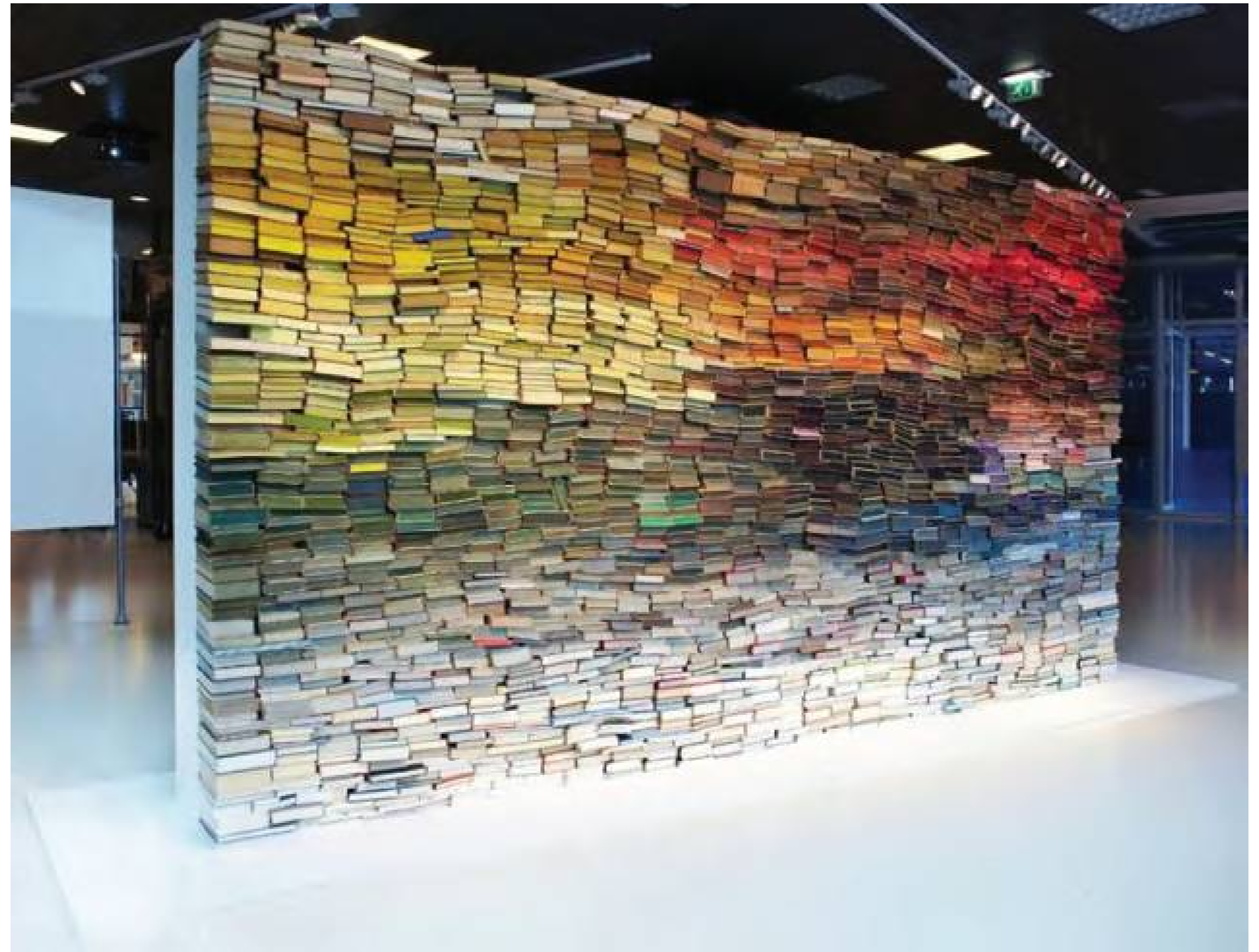
Anouk Kruithof Brooklyn, NY